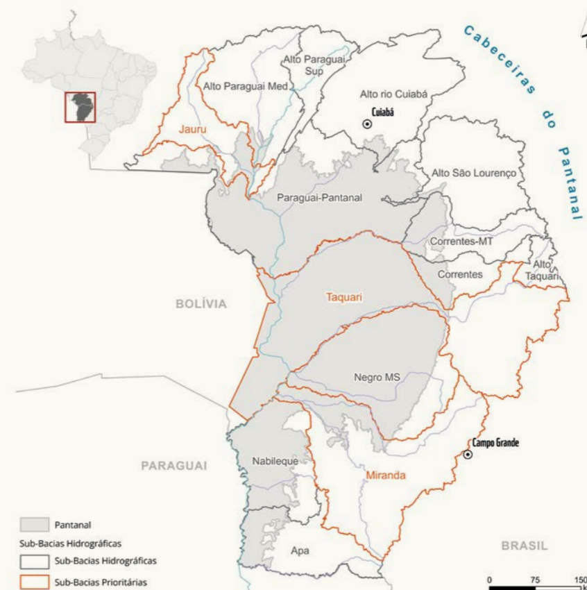
Figura 1. Localização da Bacia do Alto Rio Paraguai (BAP) e sub-bacias, com destaque para as bacias prioritárias para o WWF-Brasil

Estima-se um prejuízo superior a US$ 1,3 bilhão devido à perda de nutrientes do solo, como fósforo, potássio, cálcio e magnésio para o setor agropecuário.